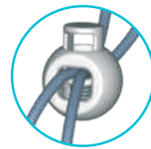
clip fermanodo clip de tension with clip Schnurzug und Spannklipp